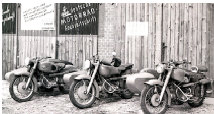
Vor dem Stuttgarter Verlagsgebäude