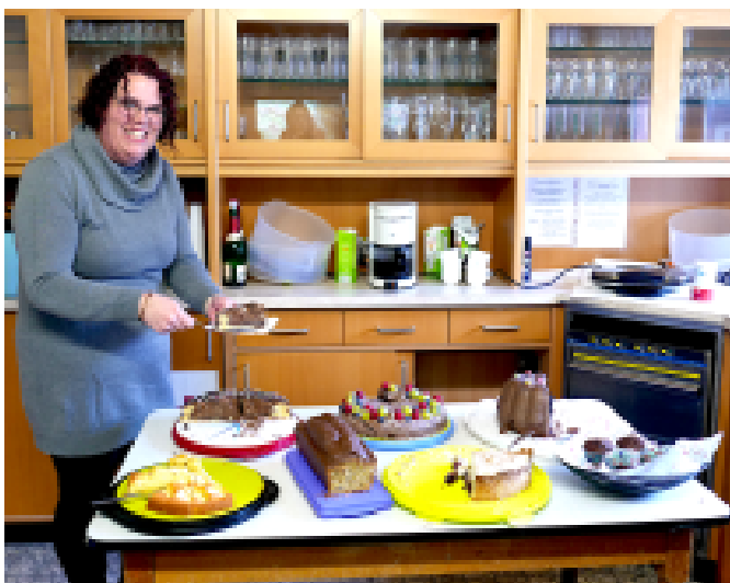
Lecker Kuchen, hausgemacht und günstig