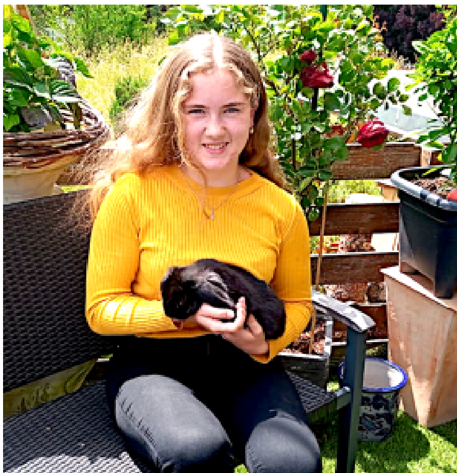
Deutsche Meisterin, Keschdeprinzessin, Trainerin und Schneckefunke

Aus dieser Begeisterung heraus begann sie dann vor zwei Jahren, den Nachwuchs der Schnecketreiber zu trainieren. „Es ist schön, mit den Kindern Ideen für die Auftritte zu entwickeln, zu sehen wie sie sich gemeinsam für das Gelingen einsetzen.“ Eine Ausbildung zur Tanzlehrerin könnte sie sich durchaus vorstellen. Durch die Arbeit mit den Kindern kam ihr auch in den Sinn, nach dem Abi vielleicht ein Lehramtsstudium zu beginnen. Jedenfalls weiß die junge Frau schon jetzt, dass sie einen Beruf ergreifen möchte, in dem sie viel mit Men-