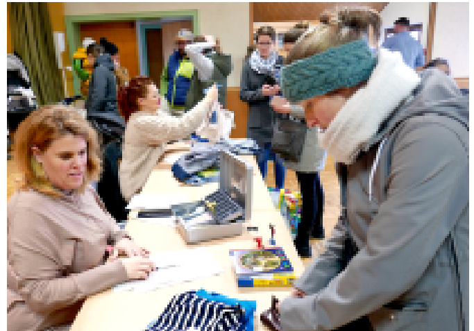
... kleiner Preis

Am Samstag, 4. März, öffnete der Bürgerverein Silz das Bürgerhaus um 14 Uhr und bereitete alles für die Teilnehmenden des Schneckenbasars vor. Es wurden Tische aufgebaut, die Waren in Empfang genommen und so hergerichtet, dass die Besucher sonntags schnell einen Überblick über das Angebot hatten und die Waren bestmöglich präsentiert werden konnten.