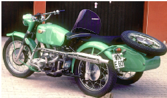
Zündapp-Gespann aus Glanzzeiten

Anfang der 50er Jahre begann die Motorisierung der breiten Bevölkerung mit dem Erwerb eines Motor-