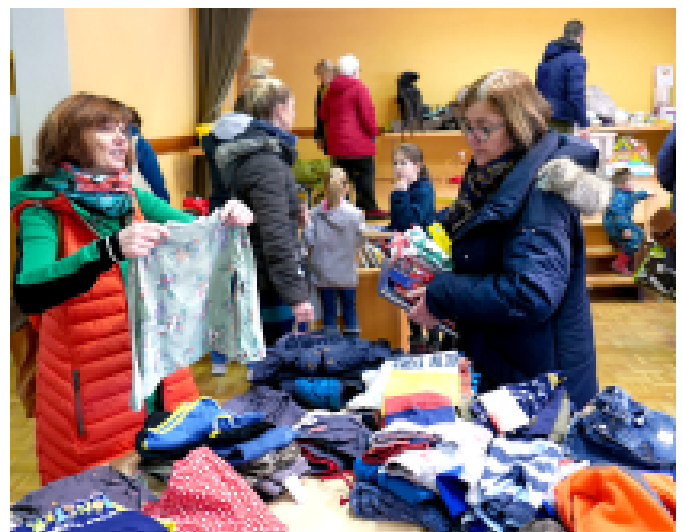
Auch die Omas kauften tüchtig ein.