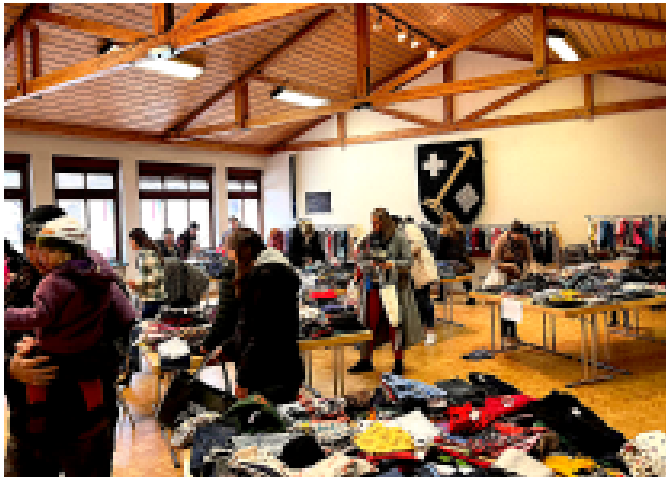
Großes Angebot ...