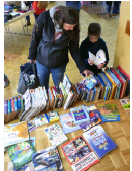
Sehr beliebt: die Bücherecke