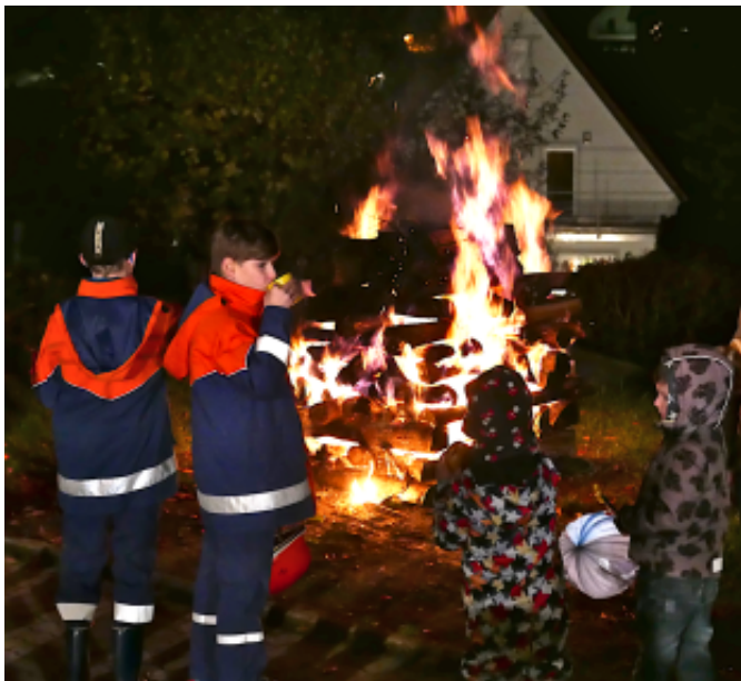
Die Jugendfeuerwehr bewachte das Martinsfeuer.

Selten sieht man in Silz so viele Kinder beisammen wie beim Martinsumzug. Vorab nahmen viele von ihnen mit ihren Eltern und Verwandten am Festgottesdienst teil, der von der Kita schön gestaltet war. Mit dem Gedanken „Wie St. Martin will ich werden, andern Gutes tun auf Erden“ stimmte man sich ein auf das Fest des Heiligen Martin, der durch seine Nächstenliebe zu den Menschen bekannt ist.