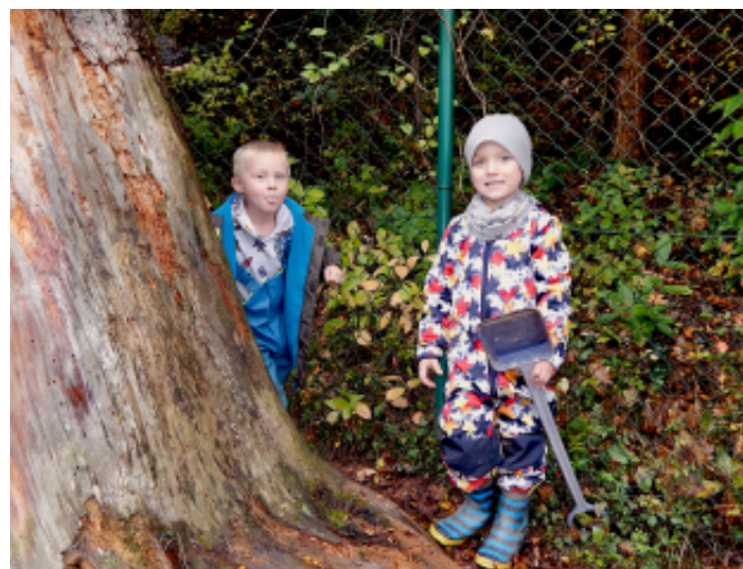
Auch die Kleinsten helfen mit

„Alle Jahre wieder“ kommt in Silz nicht nur die Weihnachtszeit, sondern auch das „Schuften für die Allgemeinheit“ in Form von Arbeitseinsätzen.